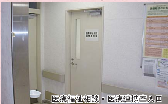
医療福祉相談・医療連携室入口