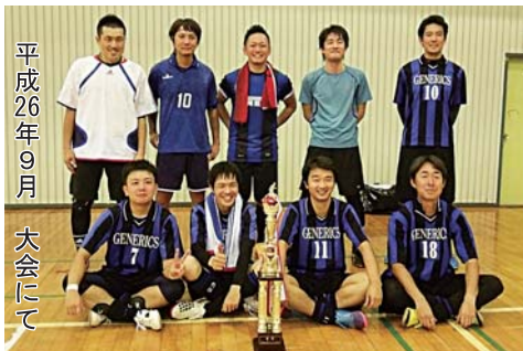
平成26年9月 大会にて